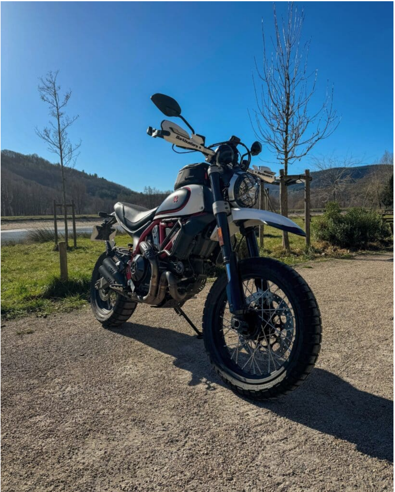
Le Lac de Ceilhes, lieu idéal pour faire une pause