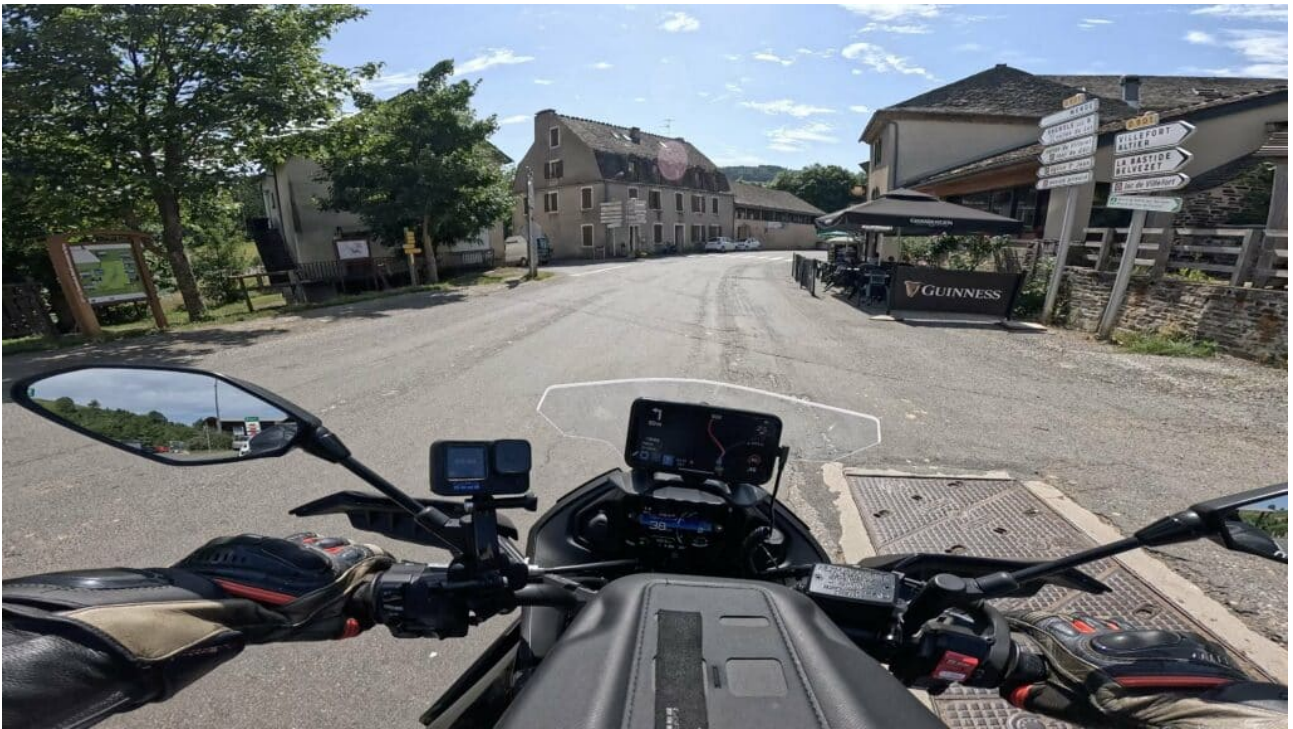
Bar au Bleynard Mont Lozère

Ce secteur dans le Parc National des Cévennes est interdit à la circulation en dehors de l'axe principal , mais il est possible de s'arrêter près de la route et de faire quelques pas pour se trouver en forêt le long des pistes de ski alpin : un endroit tranquille pour pique-niquer tout en ayant une vue sur la moto. Bien sûr, quelques kilomètres de là, le Col de Finiels est un endroit tout disposé pour faire une pause mais dans ce cas, vous ne serez pas le seul.