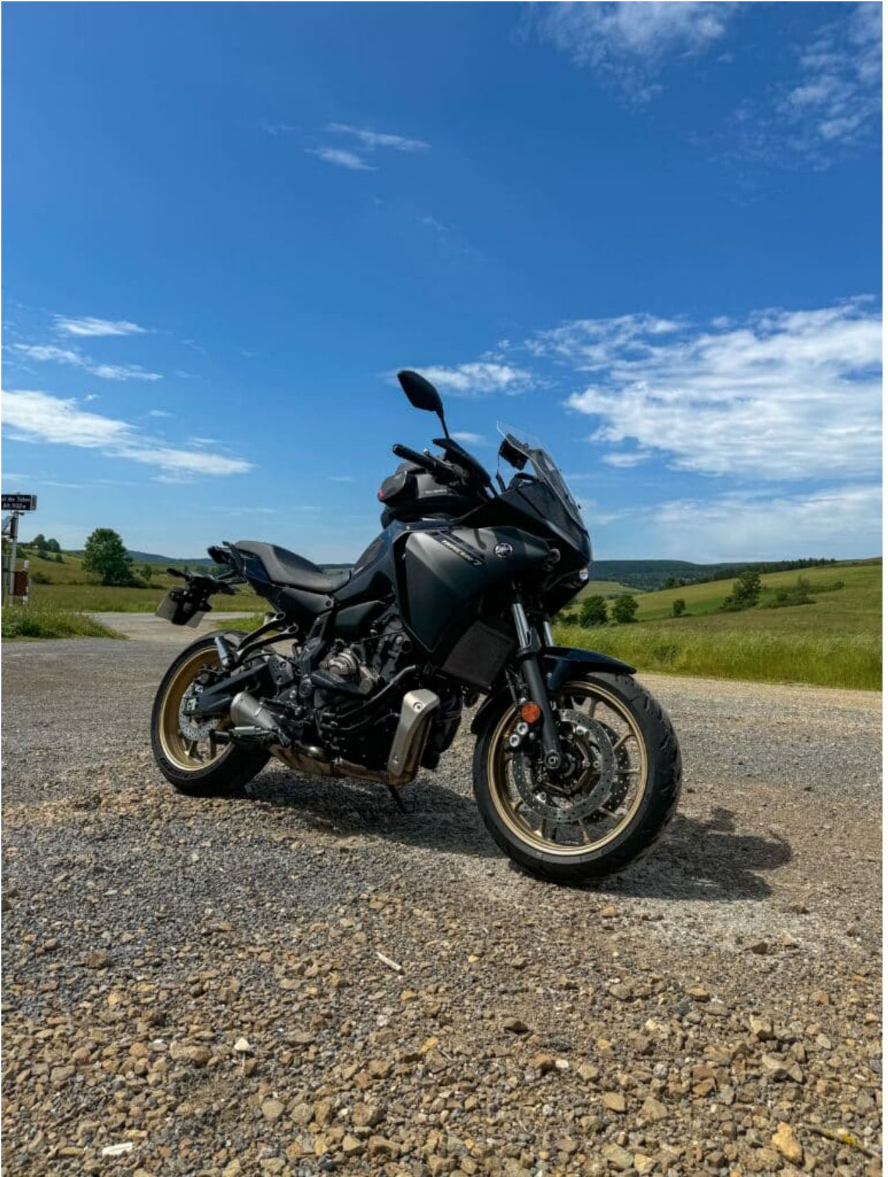
Col de Tribes, dans le secteur du Mont Lozère