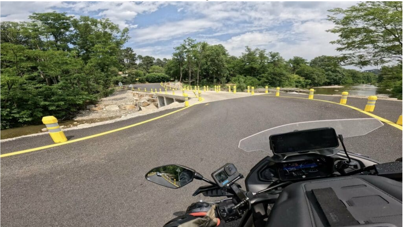
Pont provisoire jusqu'à l'été 2025

Cette route (D906) entre Gard et Lozère ne présente pas de difficulté,