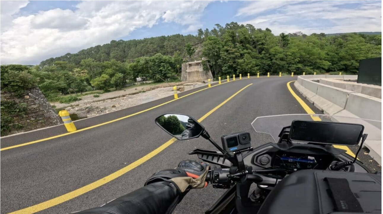
Pont effondré sur le Luech à Chamborigaud

effondré. Un passage provisoire est possible dans le lit de la rivière mais celui-ci peut être fermé en cas de mauvais temps. Le pont reconstruit est attendu pour l'été 2025.