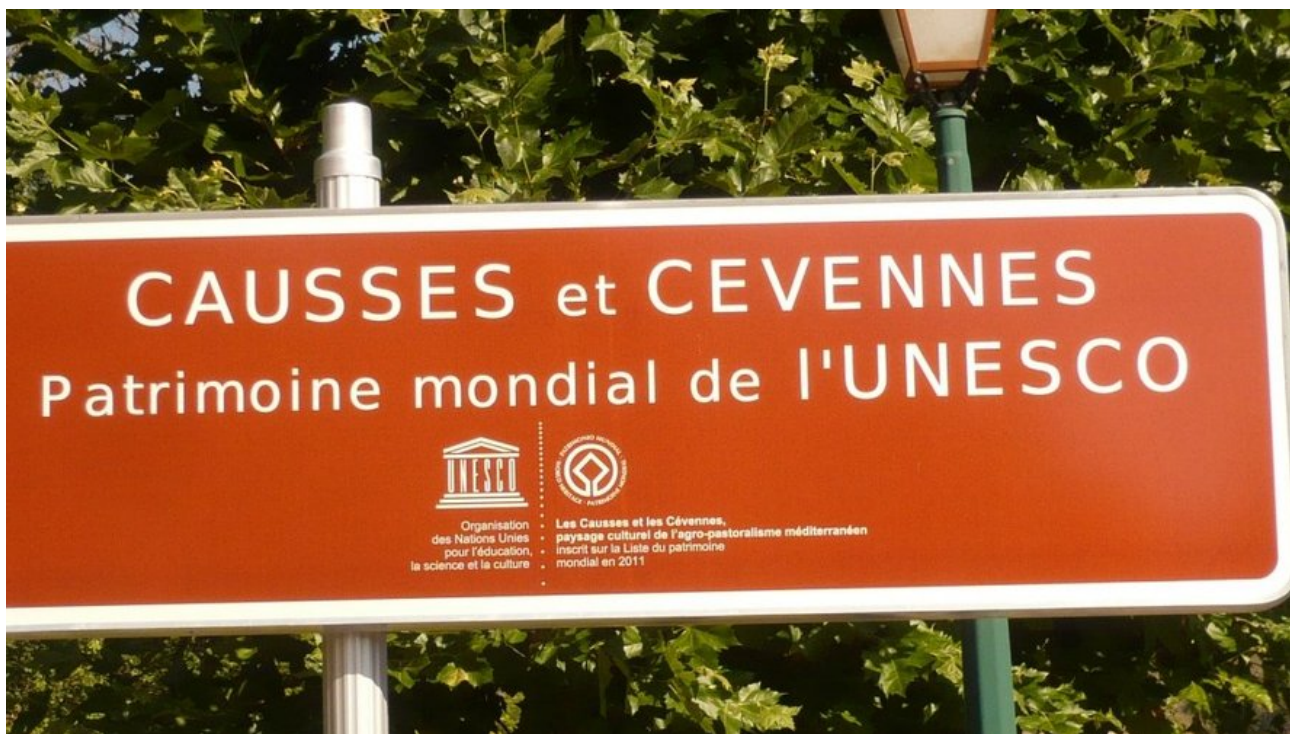
Panneau « Causse et Cévennes ».

Tout le monde parle des Gorges du Tarn entre Florac et Millau en passant par Quézac, La Malène, Sainte Enemie ou les Vignes sur la D907B (Lozère). Et si vous n'avez qu'une seule journée dans le secteur, c'est probablement un très bon choix. Mais si vous cherchez une alternative pour avoir moins de monde ou découvrir d'autres routes, que diriez-vous des Gorges de la Dourbie et des Gorges de la Jonte ?