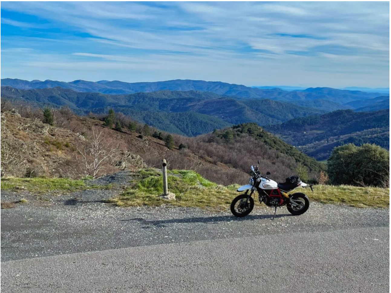
Côté Lozère, vue sur les Cévennes

En redescendant à l'ouest côté Gard, on arrive sur la Vallée Borgne . Depuis Col de l'Exil et Saint Roman de Tousque, on peut rejoindre Saumane par la D39. Un peu loin, une autre possibilité s'offre au niveau du Pompidou pour rejoindre Saint André de Valborgne par la D61. C'est cette option qui a été choisie pour ce road book. Mais il est aussi possible de prolonger son aventure sur la Corniche quelques kilomètres de plus. C'est d'ailleurs plutôt conseillé si on veut s'arrêter au fameux point de vue du Col de l'Hospitalet . Au niveau du Col de Solpérière , on peut rejoindre Vébron par la D49 et longer le Tarnon le long des Gorges du Tapoul pour revenir dans le Gard.