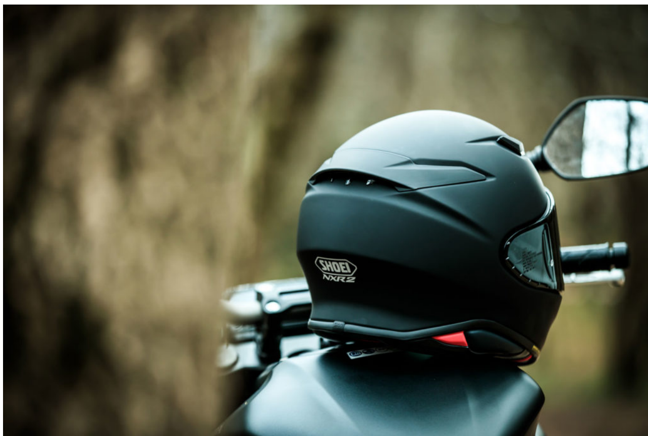
La norme 22-06 arrive sur le NXR2

La nouvelle norme corrige ces défauts. Il y a d'autres changements mais ce n'est pas le thème de cet article. Mais beaucoup ont cru que cela rendait les accessoires, comme des GoPro, incompatibles avec la norme. En réalité, ce n'est pas le cas, même si effectivement, modifier un casque en ajoutant des petites cornes décoratives, une crête, un intercom, un feu stop Cosmo Connected ou une GoPro peut impacter à la marge le rôle sécuritaire du casque.