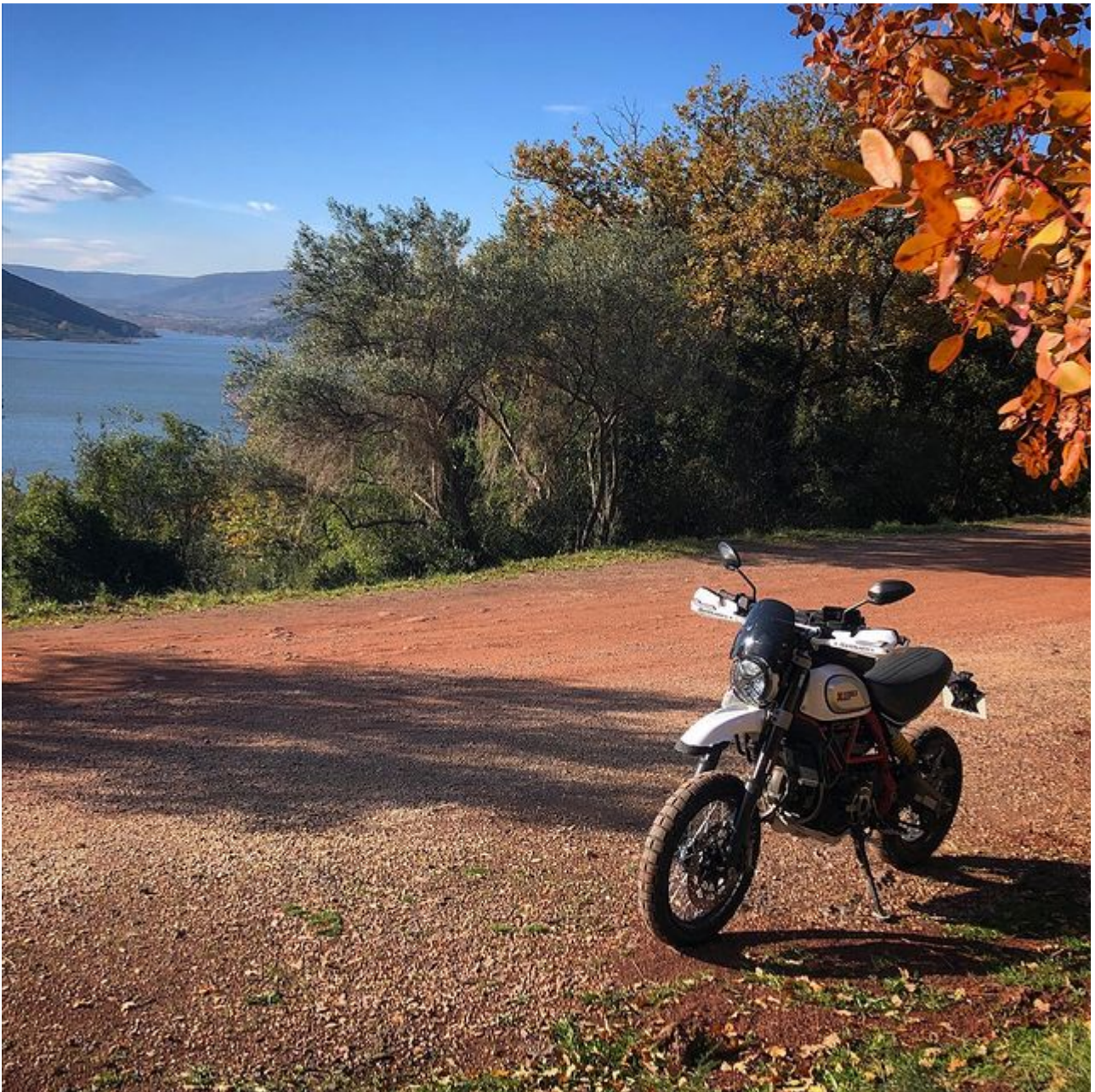
Piste ocre et vue sur le lac

Après le Salagou, au sud ouest du lac, un passage par le Cirque de Mourèze s'impose. L'ayant déjà fait et voulant rester sur une sortie courte, j'en ai fait l'impasse, mais si vous êtes en vacances dans le coin, ne loupez pas ce lieu avec les roches naturellement sculptées à la verticale.