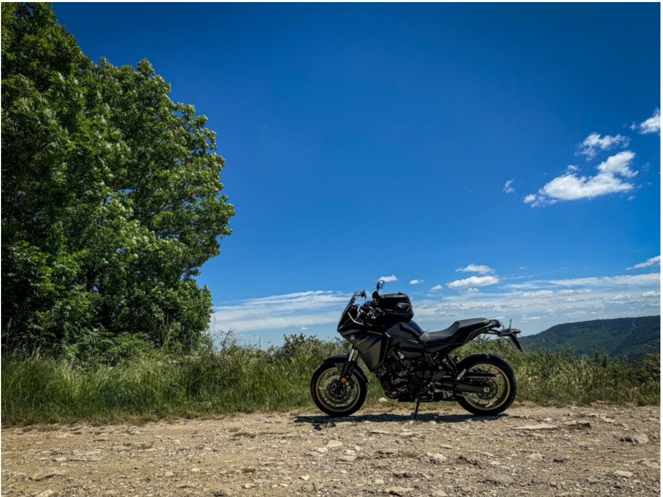
Sur les hauteurs du Pompidou

De Montpellier, après 1h30 de route vous arrivez à Saint Jean du Gard (en venant d'Anduze, Quissac, Saint Mathieu de Trévières). C'est là que débute un prologue de 10 km jusqu'au Col Saint Pierre . C'est peut-être la section la plus technique (mais qui reste accessible à tous cependant) avec le plus de dénivelé positif, en passant de 160 m à 596 m d'altitude, dans un environnement très méditerranéen et aride (donc très chaud en été ☐)