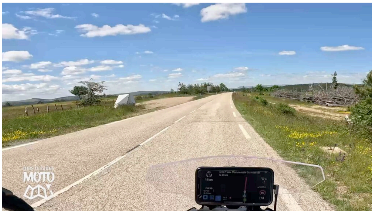
Un des radars mobiles (90 km/h)

Dans le Gard, la portion de la D260 jusqu'au Col Saint Pierre est limitée à 80 km/h. En Lozère, sur le D9, la limitation passe à 90 km/h. Deux radars mobiles sont présents sur une section de 40 km jusqu'à Florac. Ils ont été installés début 2021 pendant la période Covid-19. L'un est plutôt dans le secteur du Col de l'Exil (il y a d'ailleurs une dalle en béton, donc l'emplacement est plutôt fixe) et l'autre vers le Col du Rey ou avant la longue ligne de droite du plateau de l'Hospitalet. Parfois il est situé juste avant Florac. Dans tous les cas, la limite de vitesse à 90 km/h n'est pas problématique, vous sera sûrement à un rythme moins élevé sur cette route.