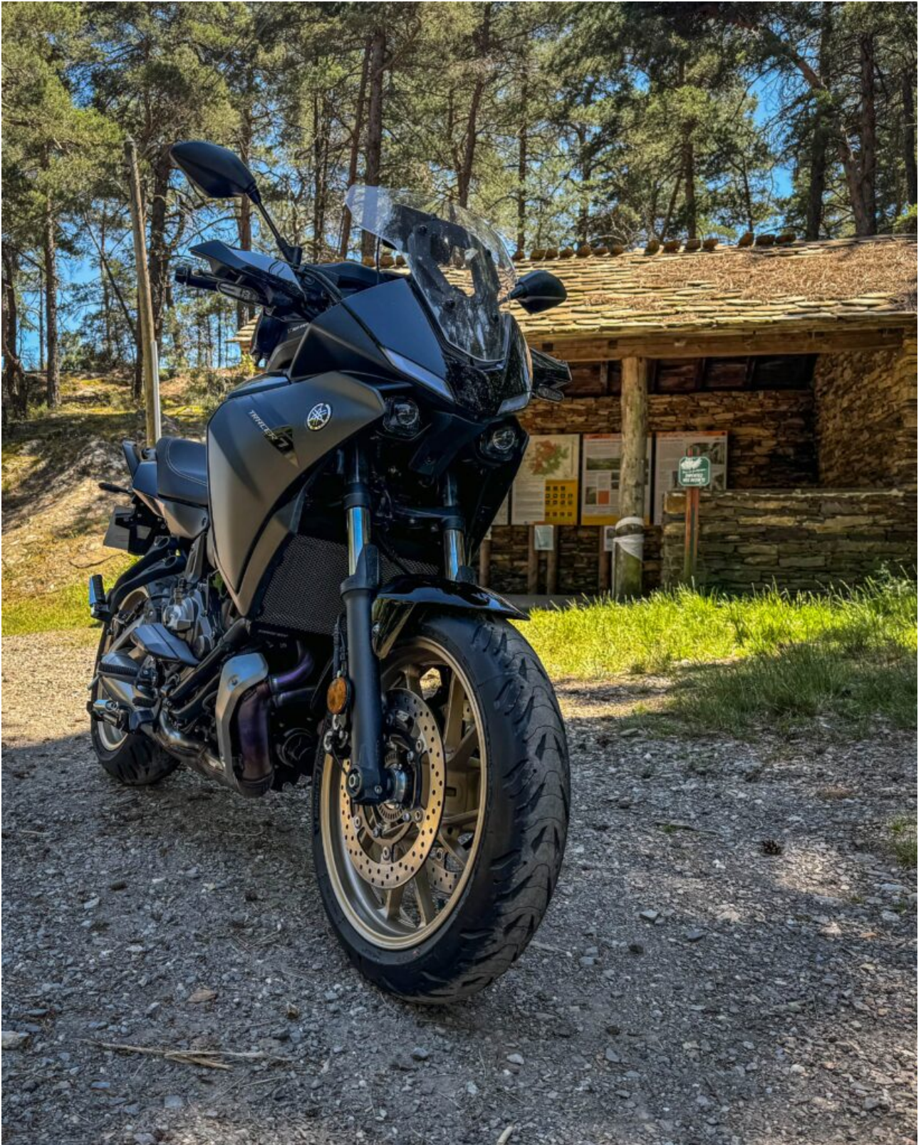
Col Saint Pierre à la limite Gard / Lozère

Pour varier, il est cependant possible de revenir vers Saint Jean du Gard par la Vallée Borgne. Depuis le Col de Solpérière, suivez la