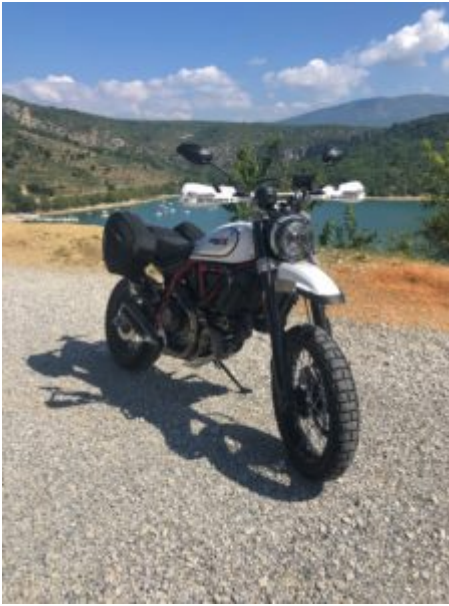
Vue sur le Lac de Sainte-Croix

Pour le premier jour, départ de Montpellier et traversée de la Camargue et du Rhône, l'objectif étant d'arriver dans les différents départements des Alpes du Sud. Au programme, la Route des Crêtes sur les hauteurs des Gorges du Verdon et du Lac de Sainte Croix . La Route des Crêtes, ou D23, est en grande partie à sens unique, seul le début et la fin sont à double sens pour rejoindre des restaurants.