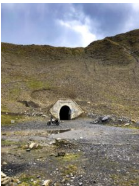
Devant le Tunnel côté Ouest

En fonction de l'affluence, cela risque de coincer surtout que le tunnel est surtout emprunté par des (gros) 4x4.