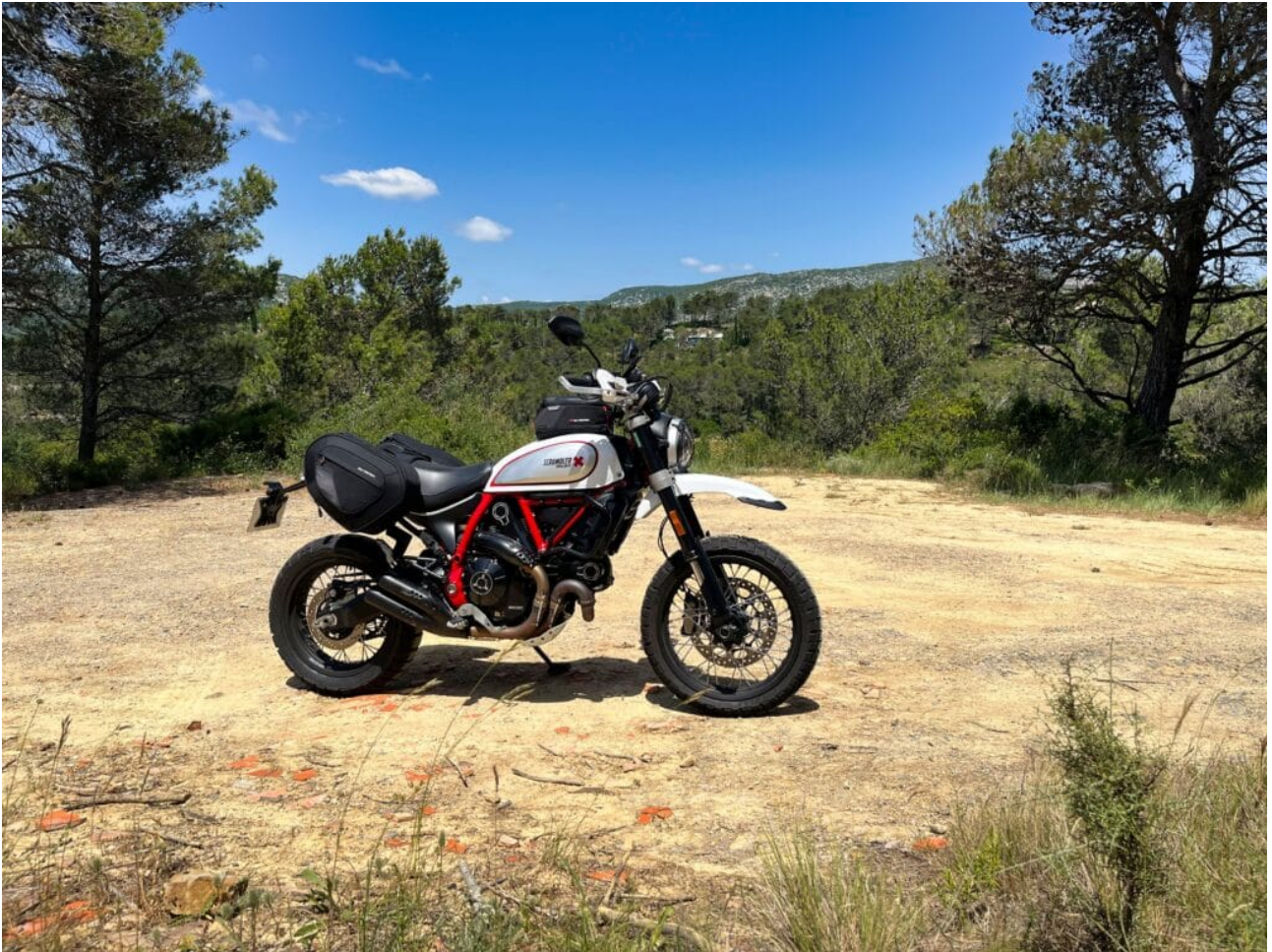
La Desert Sled en mode road trip avec sa bagagerie SW Motech

En réalité l'objectif de cette traversée de l'Aude est de rejoindre les Gorges de Galamus . Limite avec les Pyrénées Orientales, ce passage creusé dans la roche sur un peu plus de 2 kilomètres permet de relier Cubières-sur-Cinoble (D10) à Saint-Paul-de-Fenouillet (D7). Le paysage est époustouflant, mais ce n'est pas une surprise puisque c'était déjà au programme en 2017. La route est très étroite, elle même interdite aux camping-cars et aux caravanes. Les gens ont plutôt tendance à se garer sur les parkings à chaque extrémité et à faire une balade à pieds. Les plus téméraires peuvent aussi faire du canyoning, même si le niveau de l'eau au printemps 2022 est au plus bas. Ces gorges sont un incontournable du secteur, quitte à faire un petit détour si vous passez pas très loin !