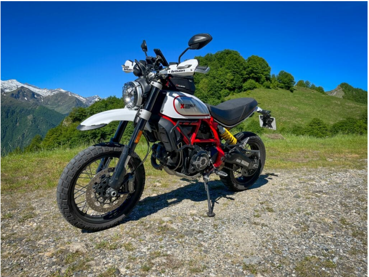
Col d'Agnès, avec les sommets enneigés

Prochain col de la liste : le Col de la Core sur la D17 puis Bethmale . La route est large, en très bon état et permet d'apercevoir les sommets enneigés. Je garde un bon souvenir de cette portion. On peut rouler sereinement, sans excès de vitesse, prendre de belles trajectoires et sans risque de faire de manœuvres lors de croisement. Malheureusement, de mon côté, cela signe déjà la fin de la route des cols. Le prochain col à l'ouest aurait été le Col de Portet d'Aspet dans la Haute-Garonne. Au niveau de Castillon-en-Couserans , j'entame alors le trajet « retour » sur la D618 en direction de Saint Giron (retenez bien cette ville, on en parlera un peu plus tard) afin de rester dans le « 09 » qui la thématique de ce road trip.