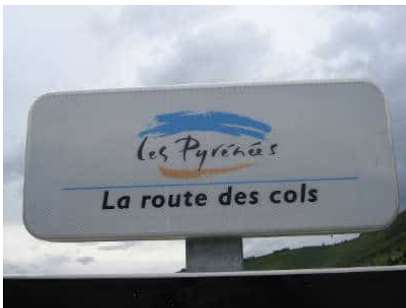
Panneau « La Route des Cols »

Le jour 2, c'est le coeur de ce road trip moto avec une boucle dans le sens horaire en Ariège . Pour la matinée, inutile de réfléchir aux routes à prendre : il suffit de suivre les panneaux « La Route des Cols ».