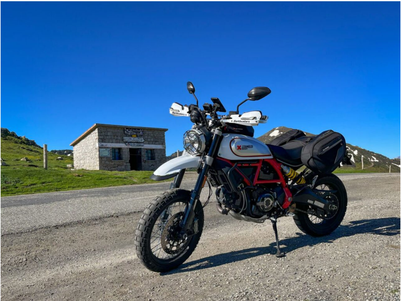
Col de Pailhères à 2001 m

La redescende est toujours dans le département de l'Ariège (la limite avec l'Aude s'effectuant dans la vallée au niveau du cours d'eau éponyme). Cette fois-ci la route est très étroite et les épingles nombreuses. La route est même construite « sur » la pente avec des murets en pierre. C'est très impressionnant et je n'avais pas le souvenir d'un endroit si délicat lors de la montée avec mon ancien roadster Honda CB650F. Cette séquence était d'ailleurs l'objet d' une vidéo dédiée en 2017 . Ultime passage devant la station de ski de l'autre versant avec Mijanès à 1 500 m d'altitude. La route redevient alors « plate » et passe devant un fantastique petit cours d'eau avec la rivière de Quérigut .