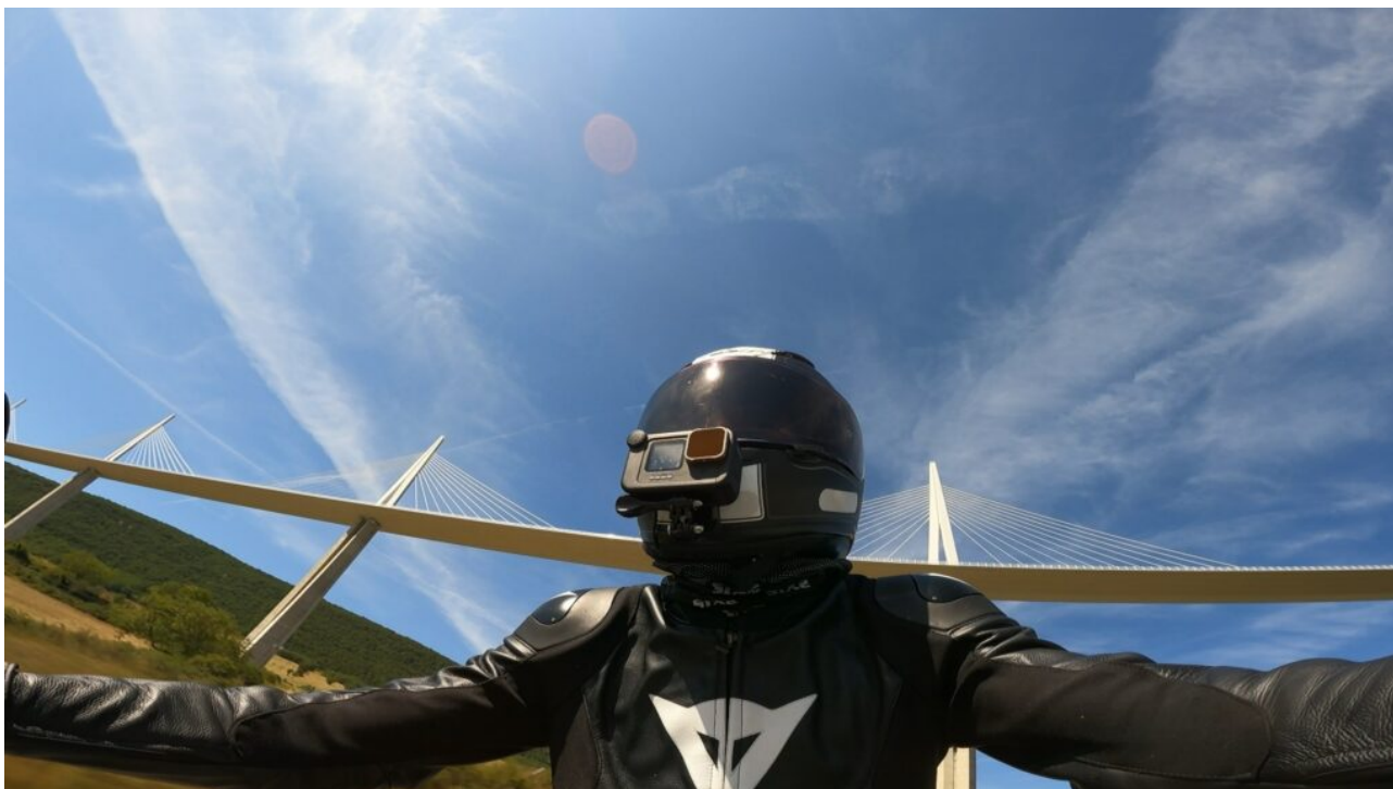
Passage sous le Viaduc de Millau

La suite du parcours permet de passer sous le Viaduc de Millau par la D999, puis la D992. Pour les amateurs de fromages persillés, une halte vers Roquefort sur Soulzon juste après Saint Affrique est possible. Vous pouvez notamment visiter les caves , sachant que l'affinage du fromage court de janvier à juillet (autrement les caves sont vides, mais la visite reste possible).