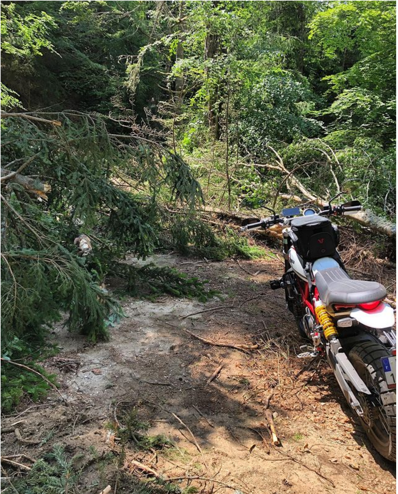
Archives – Pas de cul-de-sac sauf quand on arbre empêche de circuler