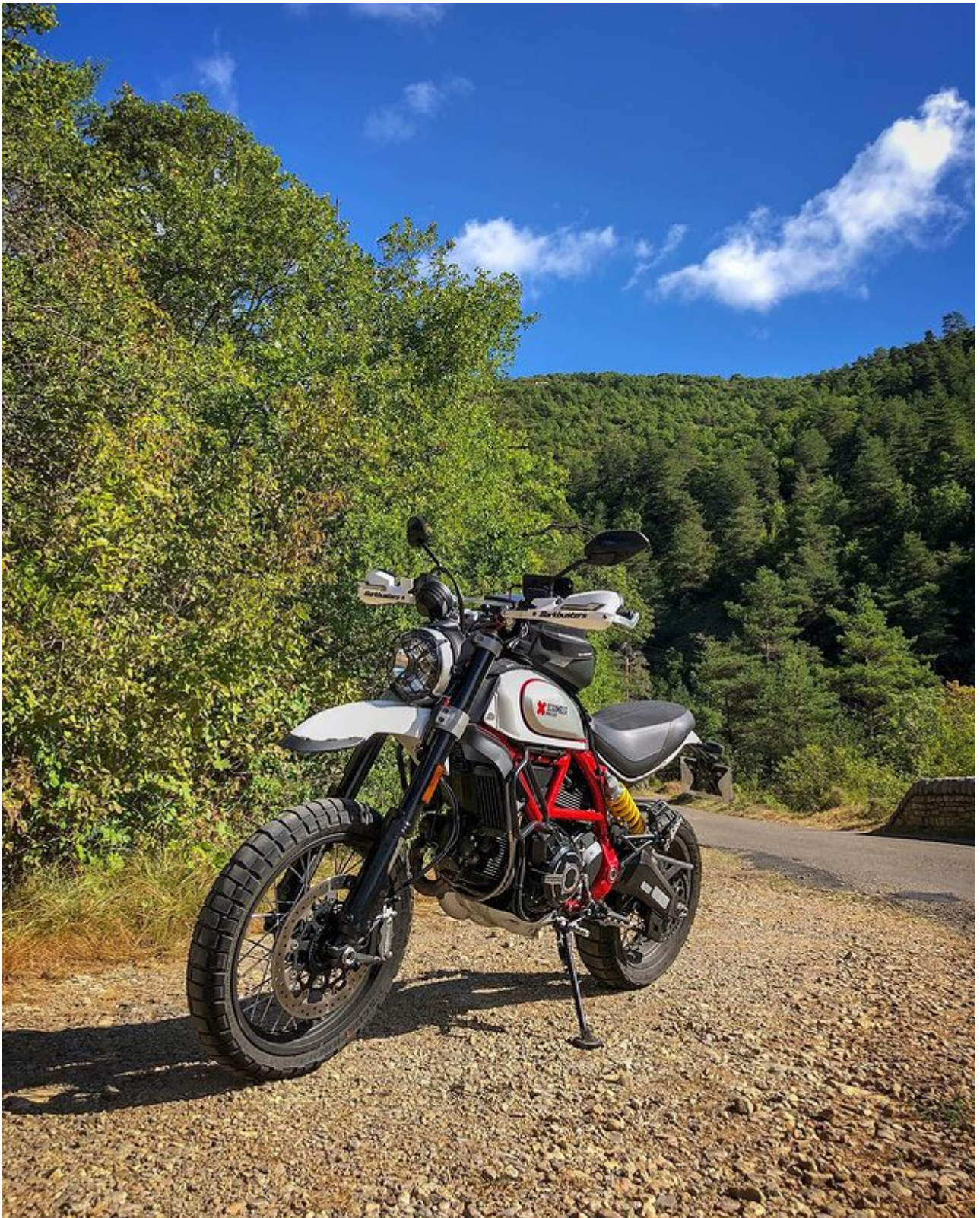
Route réservée aux « voitures » – La Roque Sainte Marguerite