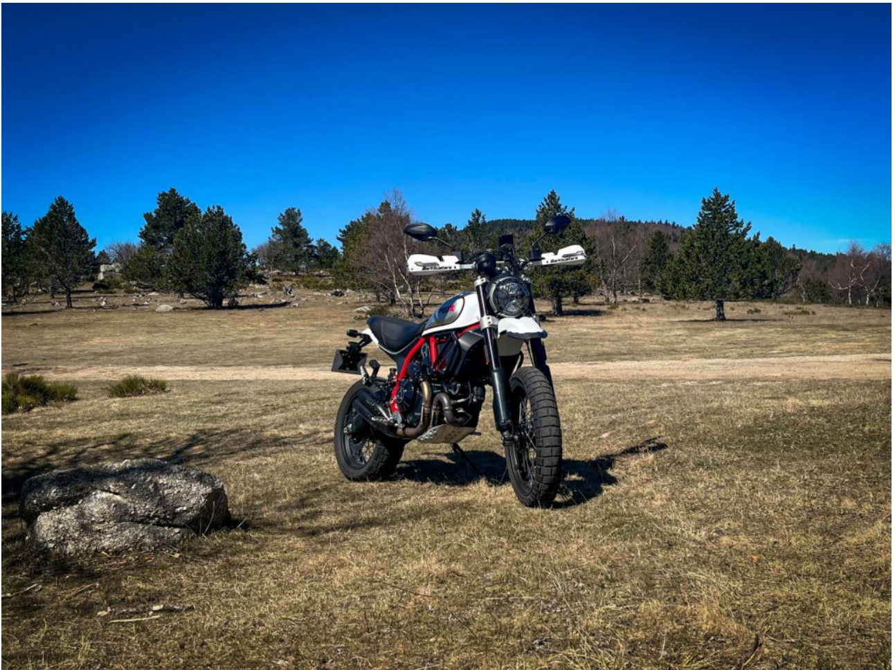
Col du Pré de la Dame, Circuit du Mont Lozère

Bref, ce secteur du Mont Lozère, à la limite entre le Gard et la Lozère, est une source prolifique pour des balades à moto !