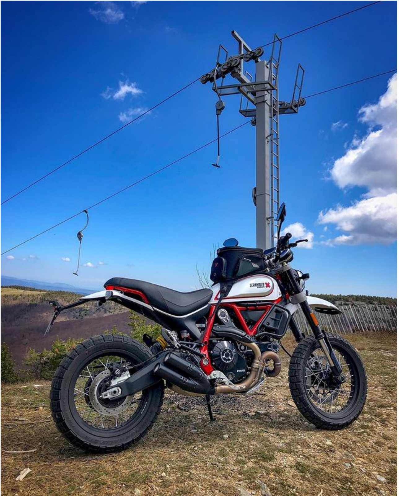
Il est toujours possible de faire du ski alpin à la station du Bleynard