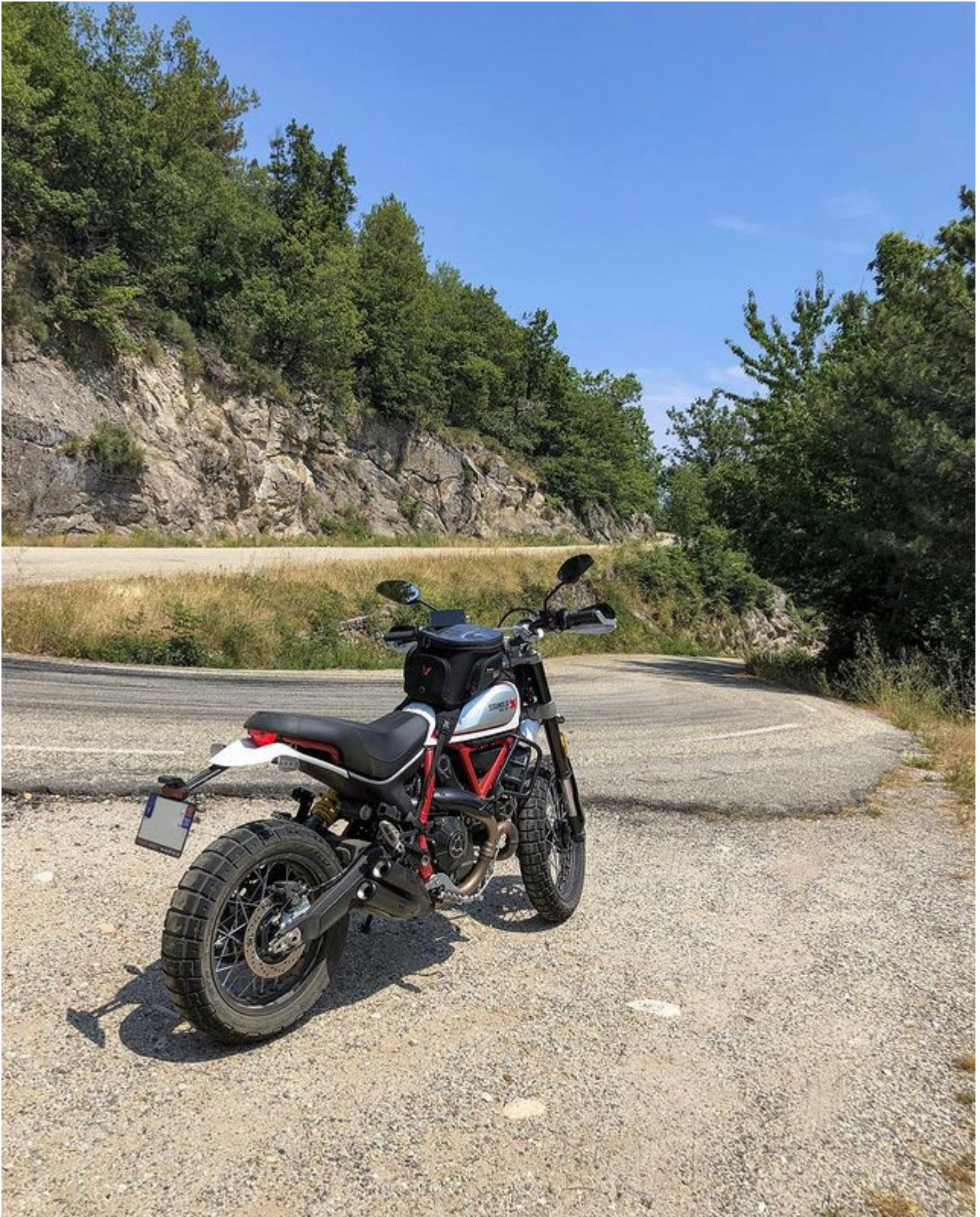
Montée pour le Col du Pré de la Dame