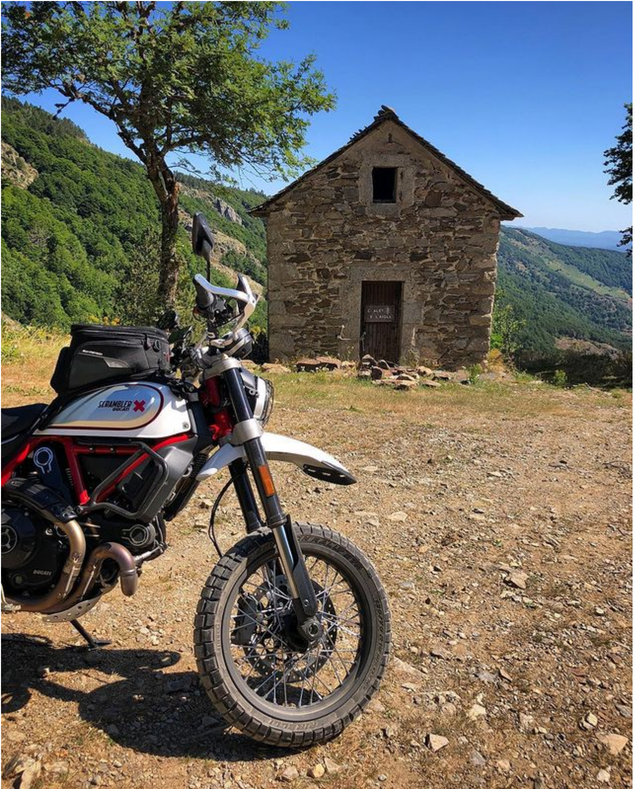
Archive – Le Chalet de l’Aigle n’est pas au programme aujourd’hui mais il se trouve à quelques minutes de là sur une piste en terre...