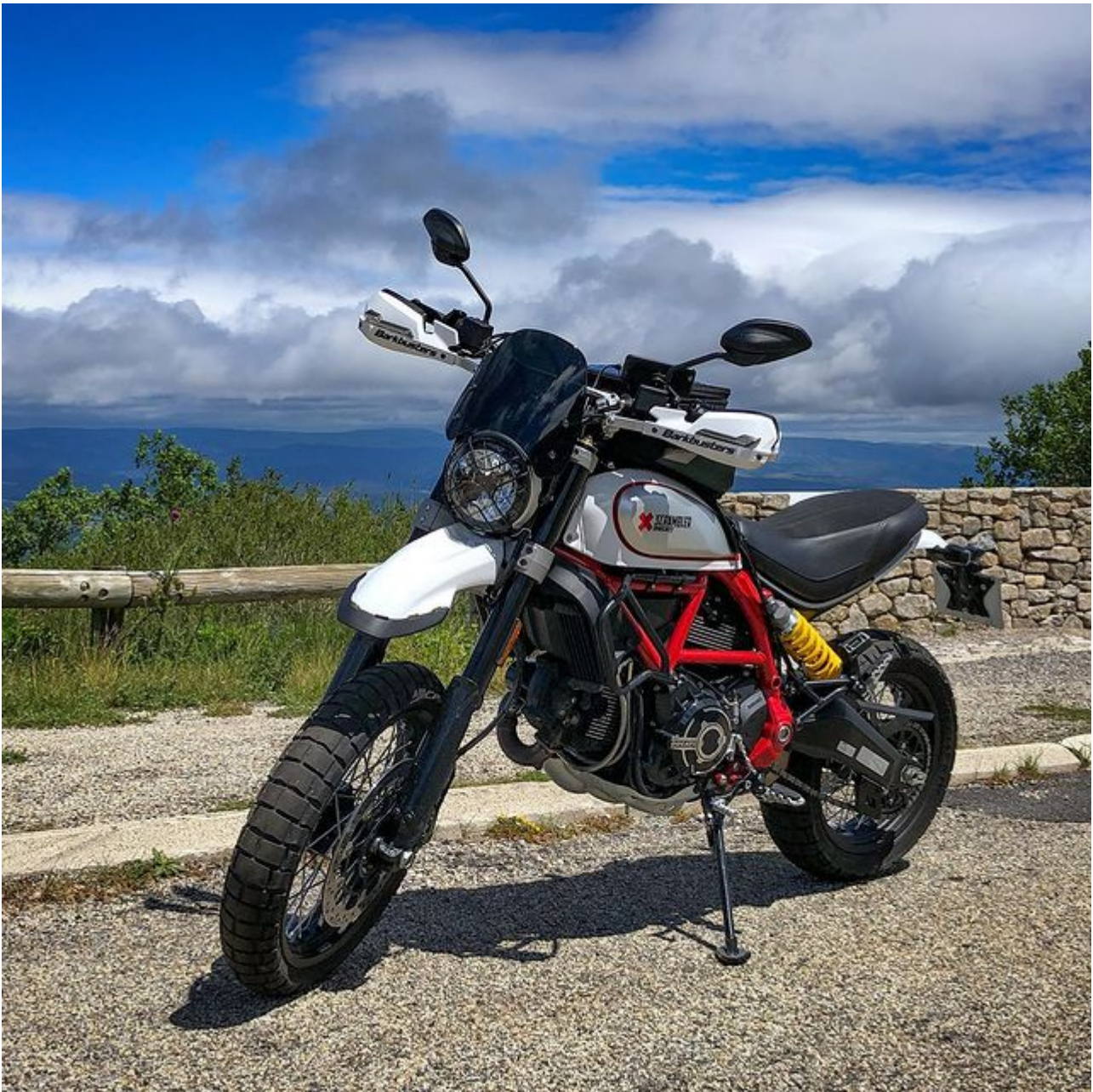
Archive – Belvédère du Pré de la Dame (1450 m)

Ce col qui est la limite entre le Gard et la Lozère permet aussi d'accéder au Mas de la Barque . Il s'agit d'une station « nature » du Parc National des Cévennes avec un ensemble de locations pour les touristes. Mais c'est surtout une ancienne station de ski alpin. Fermée depuis l'an 2000 et démantelé en 2010 , il n'y a plus aucune trace de ce passé. Je me souviens encore d'une sortie scolaire il y a fort longtemps dans cette station avec son front de neige très abrupt !