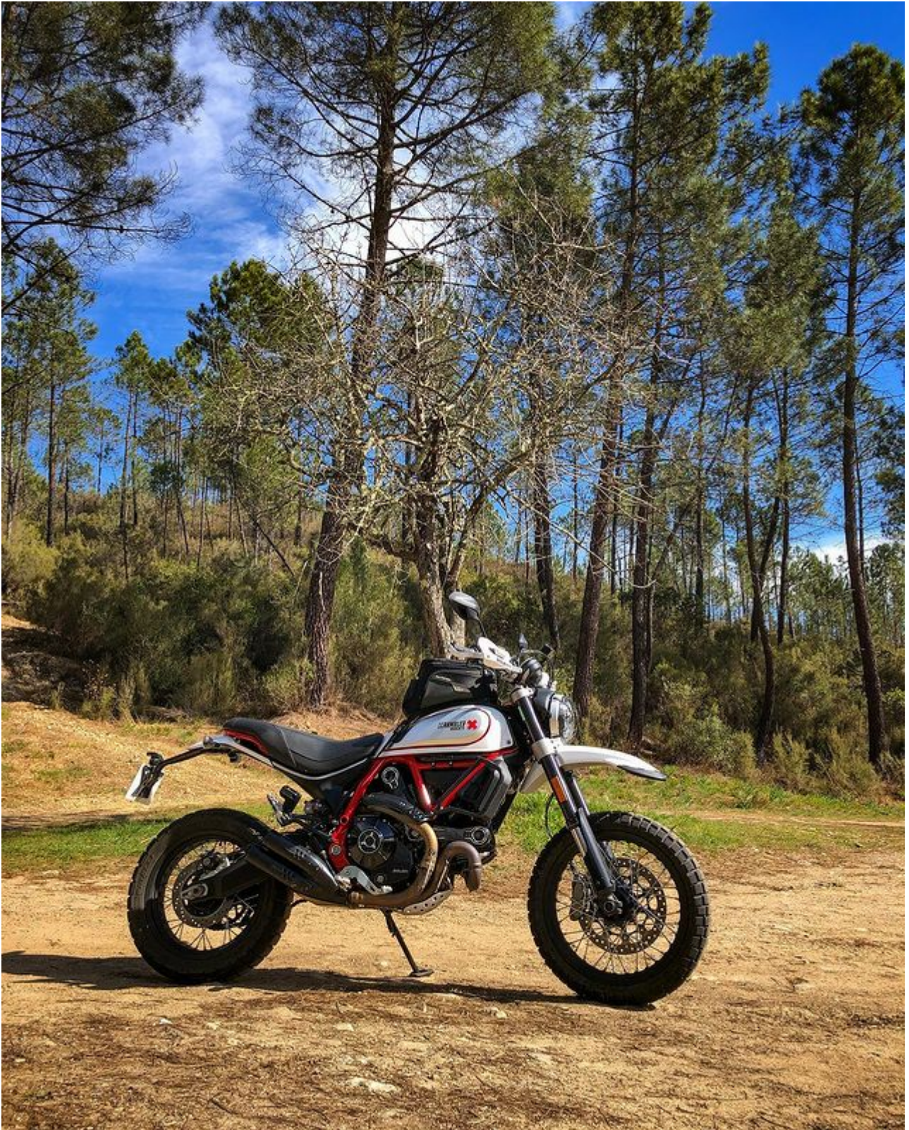
Zone boisée avant de rejoindre Les Vans