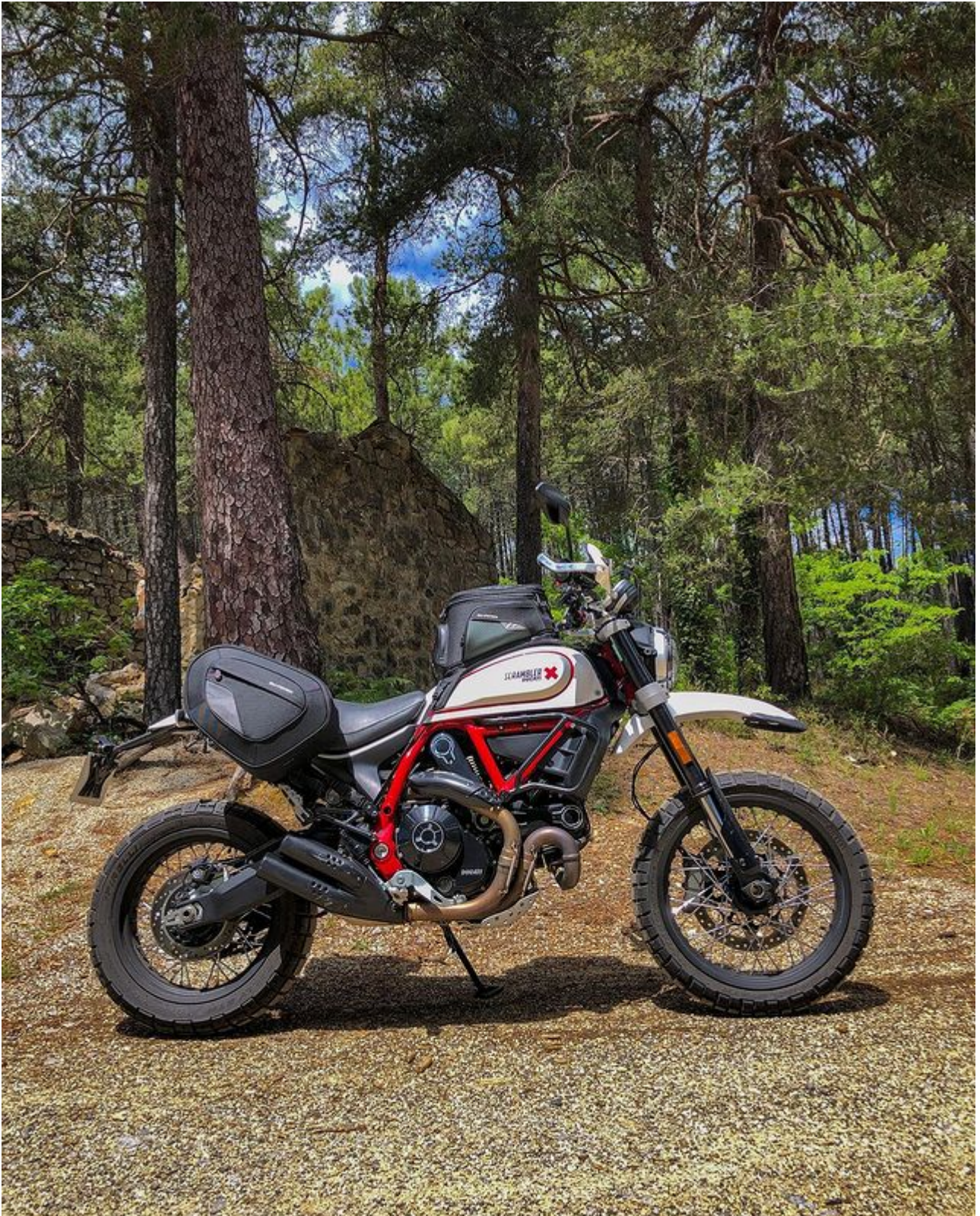
Paysage forestier avant de rejoindre Les Vans