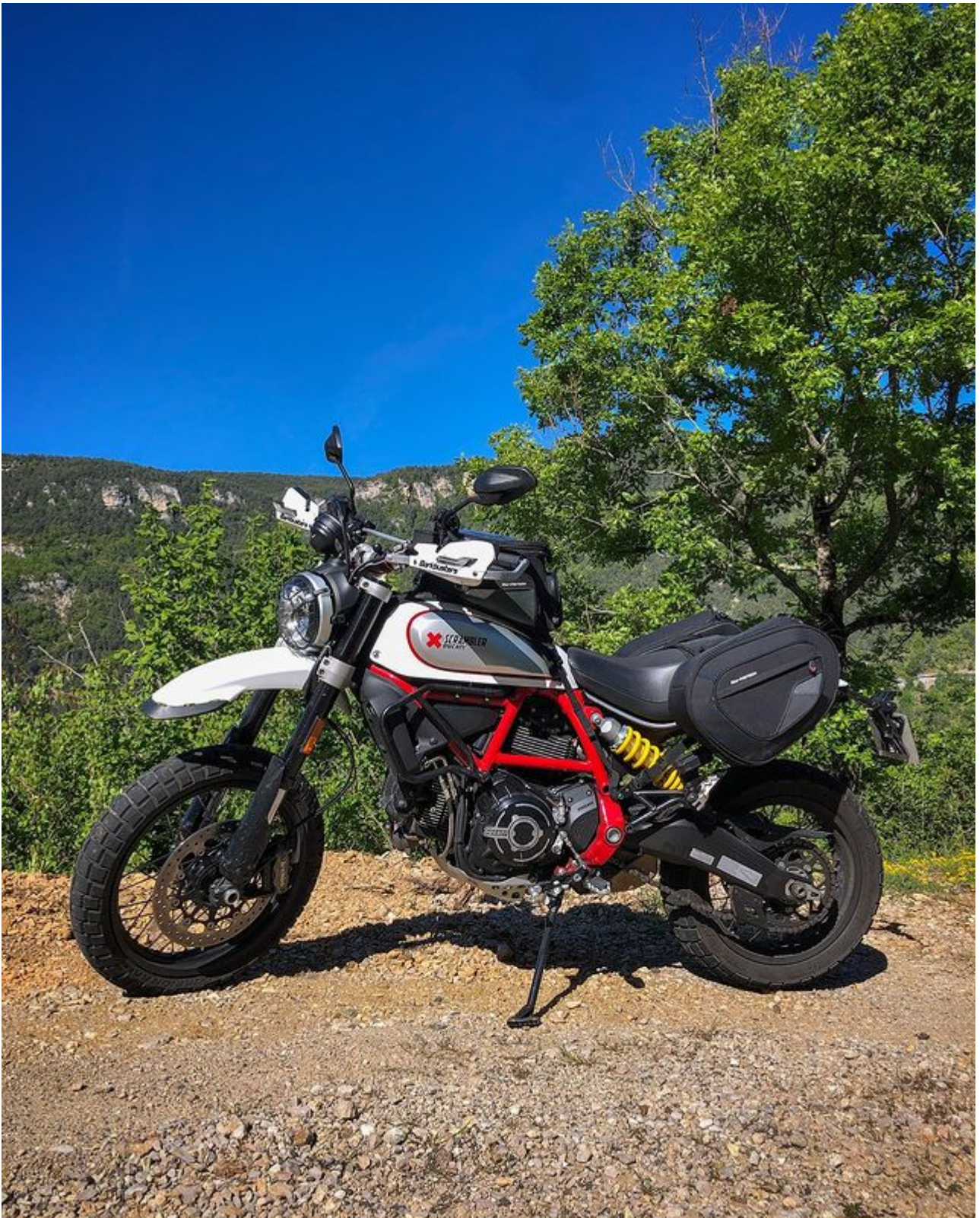
Gorges du Tarn