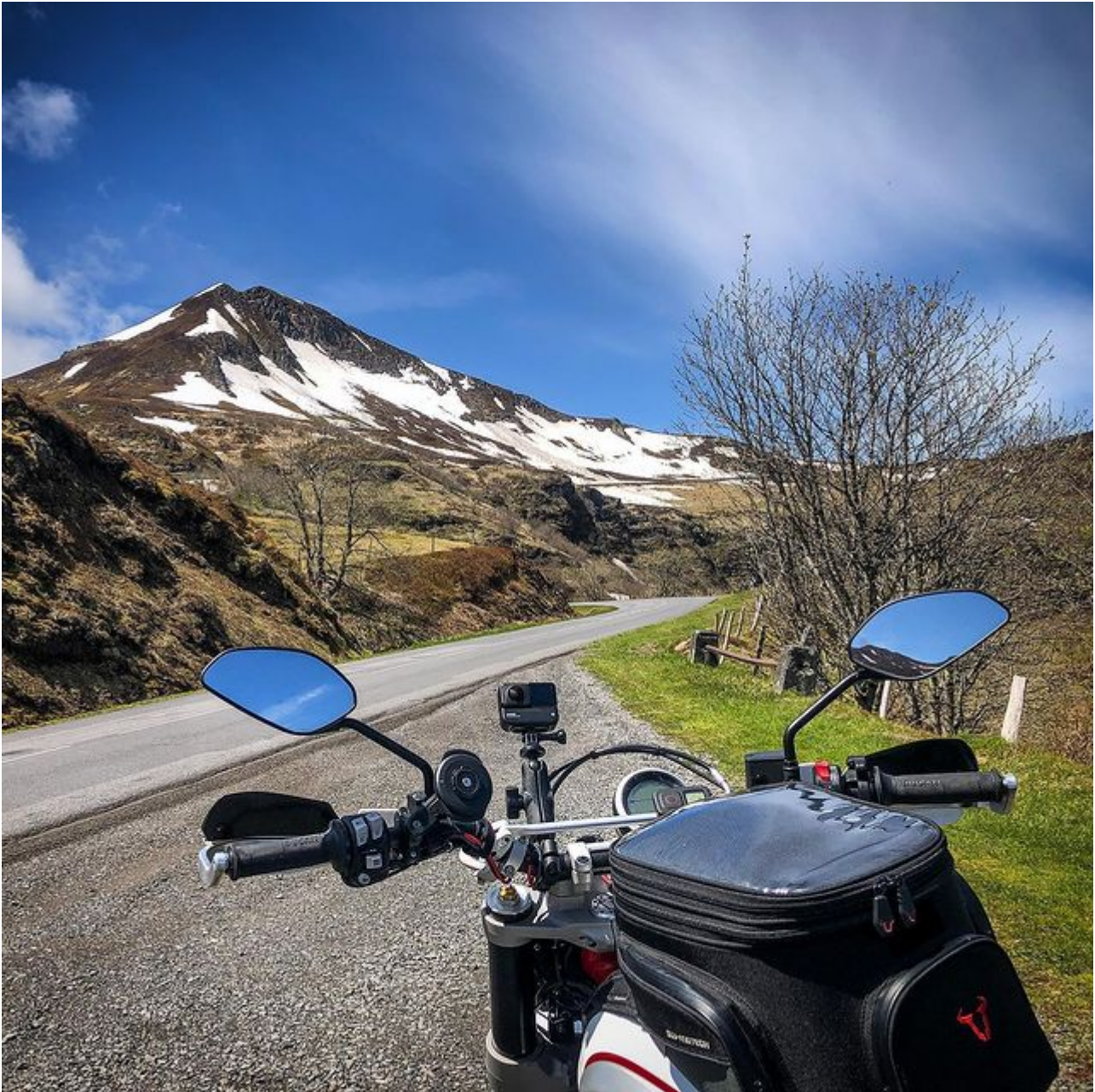
Vue sur le Puy Mary

Après Murat et Saint Flour sur la D926, direction un autre point d'intérêt du Cantal : le Viaduc de Garabit . Il s'agit d'un viaduc de type Eiffel avec une couleur rouge si caractéristique. Le viaduc enjambe la Truyère et permet le passage d'une ligne ferroviaire depuis 1888. Lors de mon premier séjour en Auvergne en 2017, ce viaduc était d'ailleurs ma première destination. Depuis l'autoroute A75, il est même facile de l'apercevoir en roulant. Une aire est également prévue pour l'observer à l'arrêt sans sortir de l'autoroute. De mon côté, profitant