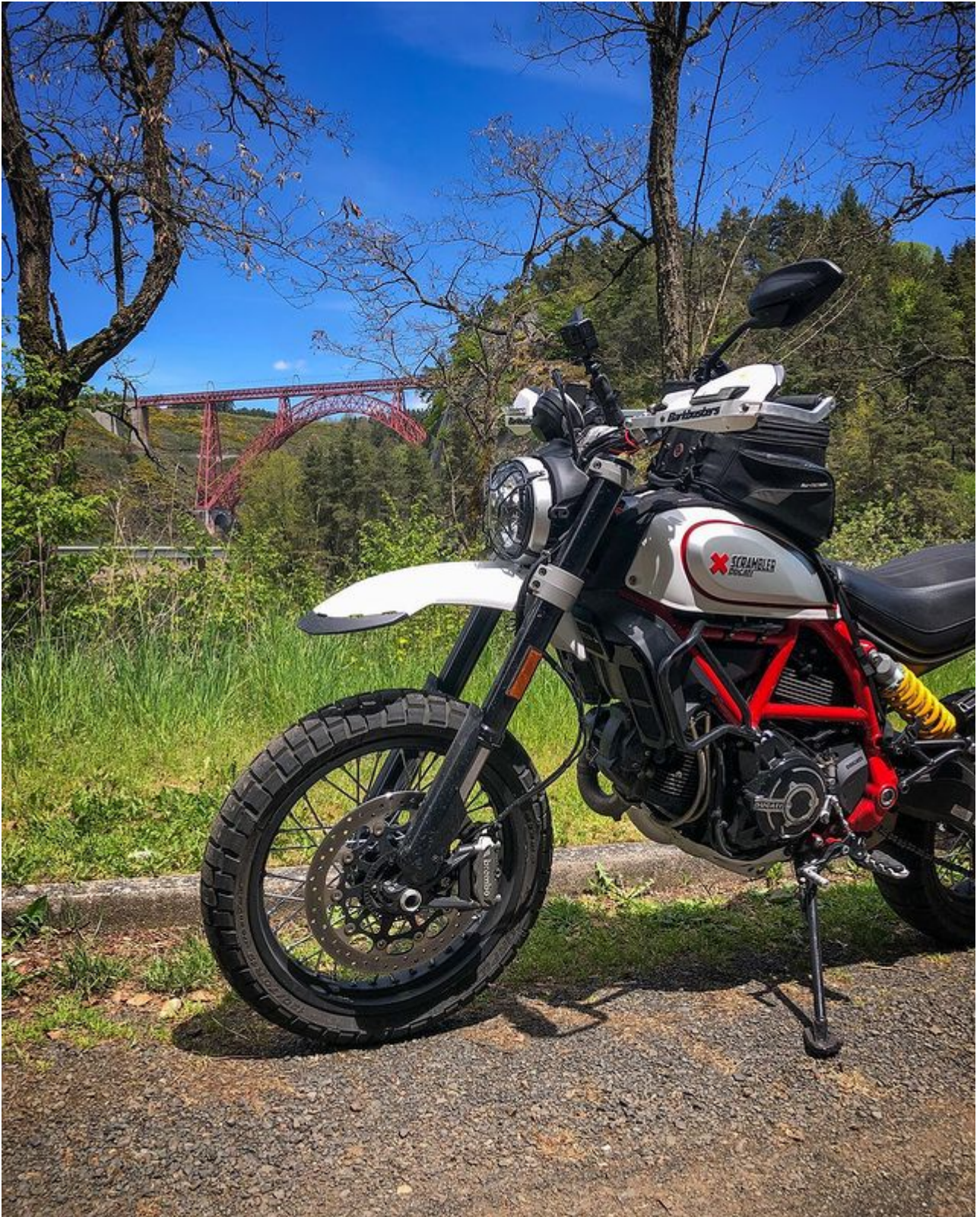
Viaduc de Garabit